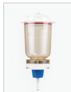
MF 5 500ml マグネチックフィルターホルダー (ロング)