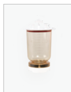
MF 5a 500ml マグネチックフィルターホルダー(ショート)