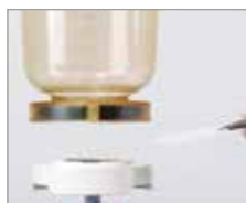
マグネットでフィルターを保持