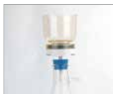
接続例①：吸引フラスコ