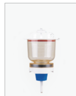
MF 3 300ml マグネチックフィルターホルダー (ロング)