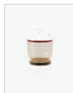
MF 3a 300ml マグネチックフィルターホルダー(ショート)